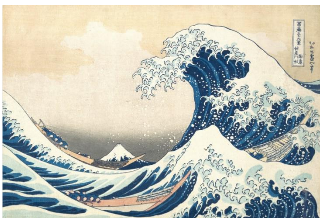
Katsushika HOKUSAI La Grande Vague de Kanagawa, 1830