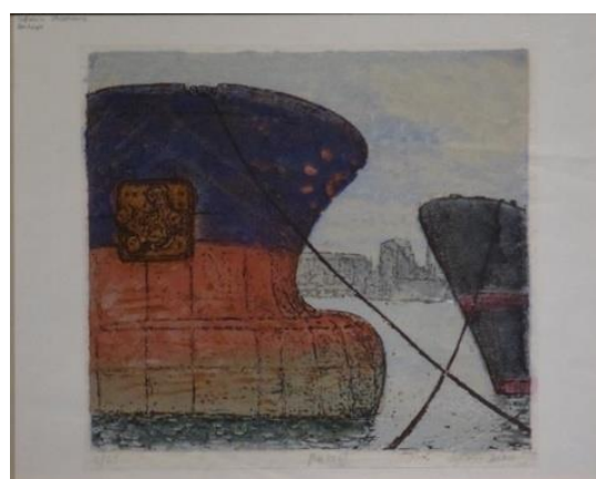
Sylvain SALOMOVITZ, « Penhoët – 1993 » Gravure sur bois tirage 4/25 (34,8 x 37,5) acquisition 2006. Artothèque de Saint-Priest